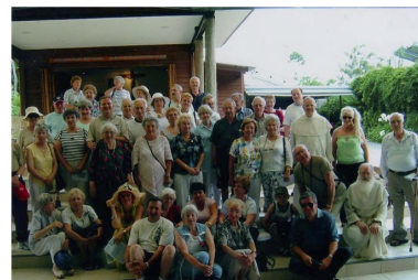
The whole group pictured in front of the Black Madonna Chapel in the Marian Valley