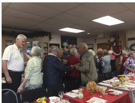
Senior's Christmas Party 2022 – Sharing Oplatek

The Seniors donated to the needy, not only in NZ but also overseas. Inevitably because of dwindling numbers, Covid-19, difficulties in parking closeby, the group folded in 2022 .