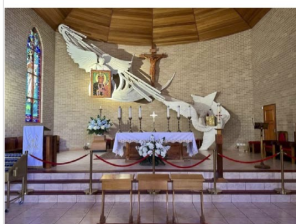
The Shrine of Our lady of Mercy

The first highlight of the pilgrimage on route from Cranberra to Sydney was a visit to the Shrine of Our Lady of Mercy (Polish Częstochowa), at Penrose Park. The shrine holds a replica of Our lady of Jasna Gora, known as 'Black Madona'. The site is ministered by the Order of St Paul the First Hermit, known as Pauline Fathers.